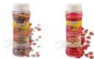
des vermicelles colorés pour décorer