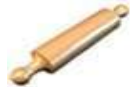
un rouleau à pâtisserie