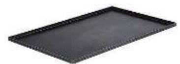
une plaque de four