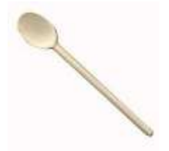
une cuillère en bois