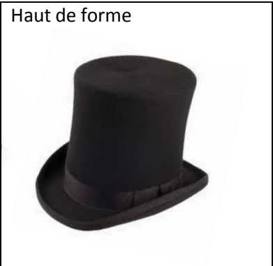
Haut de forme