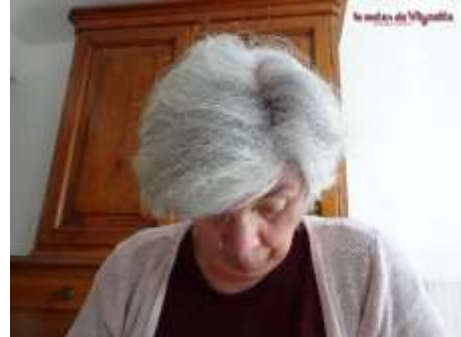
Se ruer sur