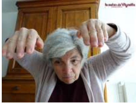
Se jeter sur