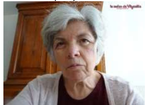
Se précipiter sur