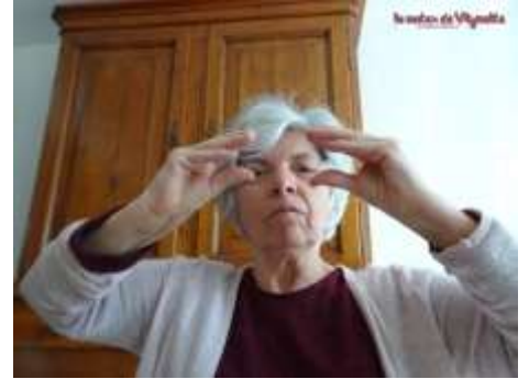
Ouvrir ses mâchoires